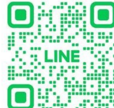
つどいのイベントなど