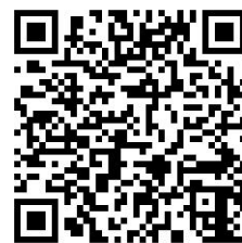
ケアプランつどい