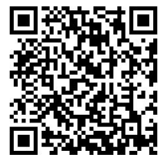
デイサービスつどい